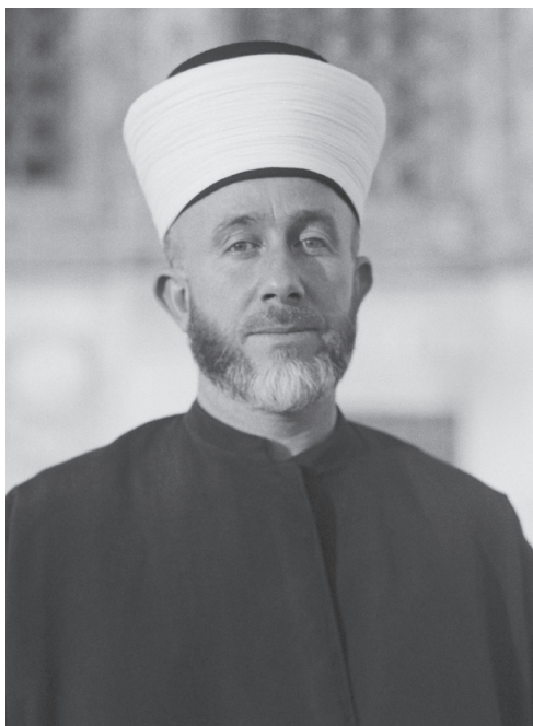
המופתי חאג' אמין אל-חוסייני. הכוונה הייתה לירות בו בשעת טיולו היומי בן הבית, אך החומה הגבוהה סביבו מנעה זאת

מיד לאחר קרב רמת יוחנן (אפריל 1948) בין גדוד המתנדבים הדרוזים ב"צבא ההצלה" לבין כוחות ה"הגנה", נשלח ח'ליל אבראהים קנטאר 40 לבסיס הגדוד הדרוזי של שכיב והאב בשפרעם. זאת כדי לשכנע קצינים בגדוד להיפגש עם משלחת של ה"הגנה" ולהביא קץ ללוחמה בין הצדדים ולהגיע לשיתוף פעולה. הוא הצליח במשימתו. משלחת קצינים דרוזים מהגדוד של שכיב והאב נפגשה בחשאי בקרית-עמל עם משלחת ה"הגנה" בראשות משה דיין. הצדדים סיכמו על הפסקת כל פעולות האיבה ביניהם, על עריקת אנשי הגדוד ועזיבתם את ארץ ישראל ועל הצטרפות הרוצים בכך לכוחות ה"הגנה". שרידי הגדוד הדרוזי נסוגו משפרעם למאלכיה. 41