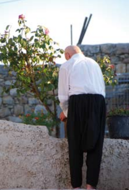
↑ בית ג'ן. אחת הבעיות של הדרוזים בישראל היא שאין להם כוח אלקטורלי